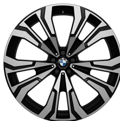
Individual alu. felne V-spoke 23"-Style 914 I 1FN