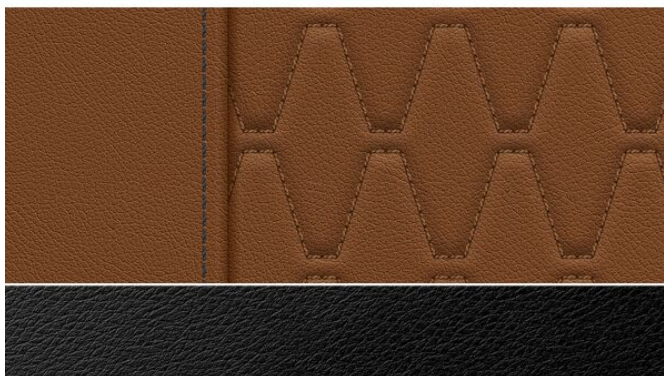
BMW Individual proširena koža "Merino" | Tartufo VATQ