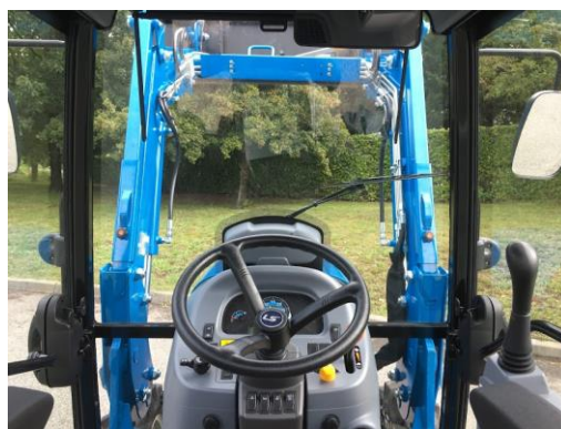
Le chargeur LS offre une parfaite visibilité quand il est associé à l'option cabine.